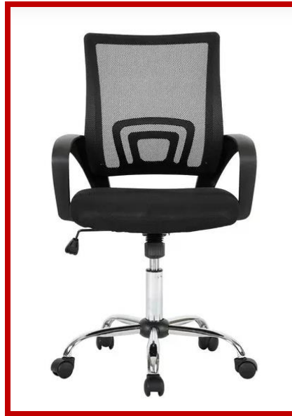
Figura 02 - Ilustrativa

1.2 aquisição de 40 (quarenta) cadeiras giratórias executiva cromada, peso máximo suportado 120 (cento e vinte) kg, ajuste de altura em até 10 cm, base giratória em 360°, reclinável, mecanismo com cilindro de gás classe 3 com 100 mm, revestimento em tela mesh respirável, enchimento de densidade moderada, rodas de nylon, braço com 100 mm, base cromada 47 mm, dimensões e peso do assento 47cm x 47 cm, encosto 43 cm x 47 cm, altura de 88,5 cm a 98,5 cm, peso de 8,6 kg, garantia de 6 (seis) meses, de acordo com a Solicitação de Compras nº 104490. Marcas de referência: Multi, Santiago Rivatti, Healer Luke, Kza Bela, não obstando participação de marcas similares ou equivalentes.