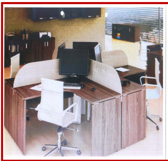
Figura 01 - Ilustrativa

1.1 aquisição de 10 (dez) estações de trabalho (cada uma com 04 mesas) em formato "L", sem gaveta, furo para passar fiação, medindo no comprimento 150 cm, largura 150 cm, profundidade 70 cm, em MDF de 18 mm de espessura, com os cantos arredondados cor titânio, pés e estrutura em metalon 30 mm x 50 mm, contruída em chapa 15 (1,55 mm), acabamento dos pés em prolipopileno, fixado no MDF por parafusos fenda phillips, cabeça chata, altura 74 cm, garantia mínima de 12 meses, painel divisor medindo 150 cm x 50 cm, conforme Solicitação de Compras n.º 105833.